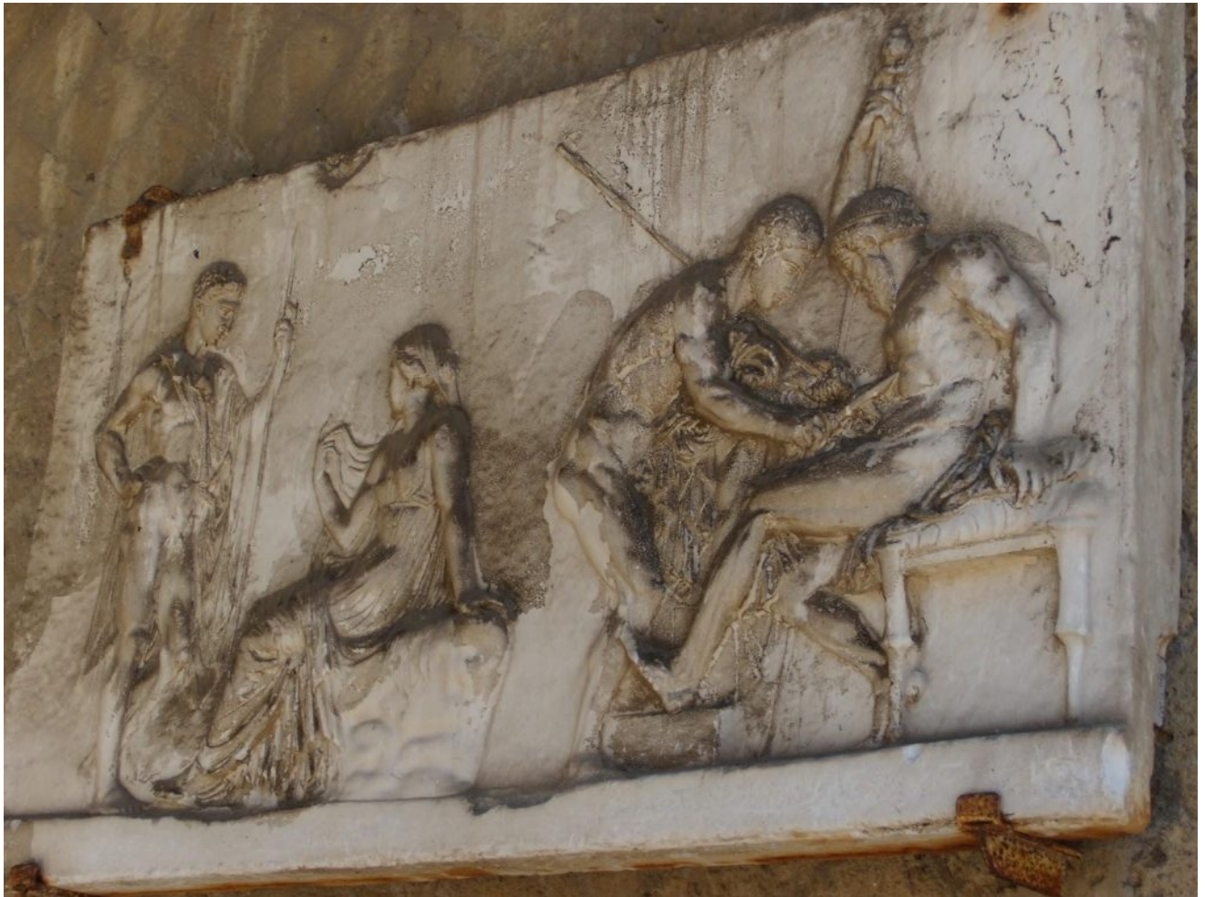
Abbildung 1 – Odysseus schabt Rost vom Speer des Achilles in die Wunde des Telephos – Relief in Herculaneum

Dieser Mythos wird von Euripides berichtet, ist aber nur noch fragmentarisch überliefert [15]. Bevor die Griechen Troja erreichten, landeten sie zu weit südlich, im Land der Mysier, kamen mit denen in ein Handgemenge bei dem Telephos, der König der Mysier, verletzt wurde. Die Griechen zogen weiter, die Wunde schwärzte. Als Telephos ratlos war, machte er das, was alle Griechen taten, wenn sie verzweifelt waren: Er sandte zum Delphischen Orakel. Das ließ ihm ausrichten: „Ho trosas kai iasetai“ der, der die Wunde schlug, wird sie wieder heilen. Das Rätsel wurde von Odysseus gelöst. Er nahm den Speer des Achilles, der die Wunde geschlagen hatte, schabte dessen Rost in Telephos' Wunde, die daraufhin heilte. Dieser Mythos war in der Antike weit verbreitet, wie das Relief, das man in Herculaneum gefunden hat, bezeugt (Abb. 1; es gibt eine ähnliche Abbildung auch auf dem Pergamonaltar im Berliner Museum, wenn ich mich recht entsinne).