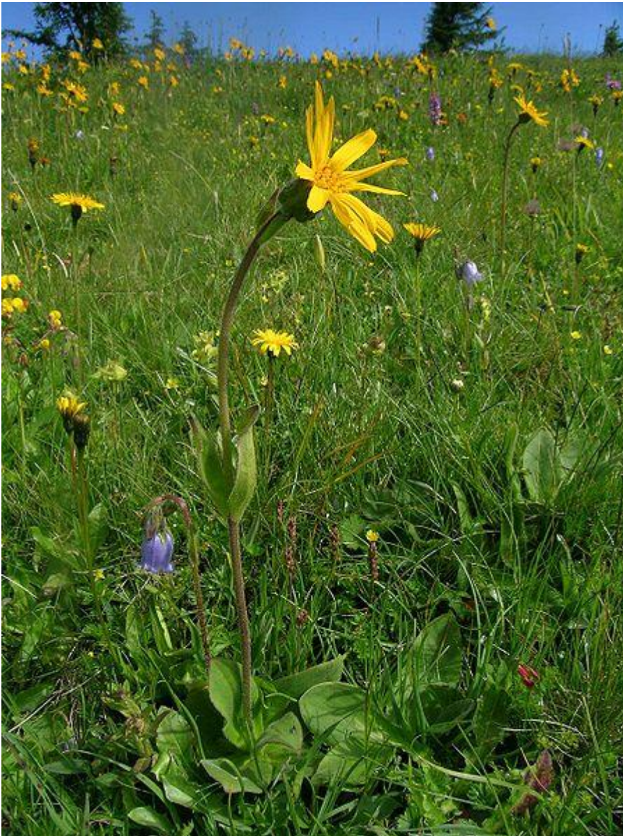
Abbildung 2 Arnica montana

Arnika ist eine alte Heilpflanze. Man nennt sie auch das "Fallkraut" oder das "Bergwohlverleih". In alten Tinkturen zum Einreiben bei Schmerzen kommt es oft als Auszug vor, obwohl eine "reine" Anwendung in der Regel nicht günstig ist, weil sie Hautreizungen verursachen kann. Arnica wächst in den Bergen, auf Höhen zwischen 800 und 1400 m etwa, je nach Klima. Ich habe sie dort bei Bergwanderungen des "Älteren" gesehen, nicht aber in tieferen Lagen.